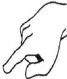
Рисунок 3 – Жест указания

Задание 3. Выразите свое недоверие к словам партнера по общению различными речевыми и невербальными средствами.